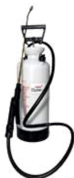
P.G.P.V. 50 :

Pulvérisateur plastique à pression préalable ou à air comprimé.