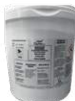
1015P-NAT 6 Kg