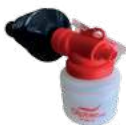
P.S.P.M. 10 :

Contenance 5 litres (soit 2 à 3 kg de poudre), poids (à vide) 3 kg, joints Viton, plongeur en laiton, soupape de sécurité, tuyau PVC de 1,5 m, poignée revolver avec aiguille de projection en laiton.