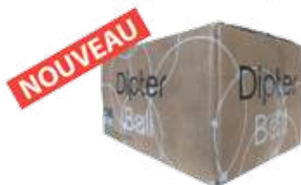
DIPTER BALL 1015B VERT carton de 500 billes

Insecticide en bille au pyrèthre végétal