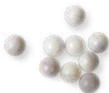
1014B à utiliser avec le PILP Sacs de 100 billes

Pine T Pro Ball Billes Phéromones pour la confusion sexuelle papillon processionnaire du Pin