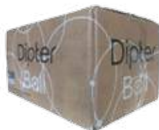
DIPTER BALL 1015B/500 Carton de 500 billes

Insecticide en bille "spécial frelon asiatique"