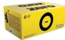
BILLE DEMO Carton de 2000 billes

Billes de démonstration sans insecticide