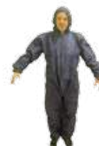
SCJ Boîte de 50