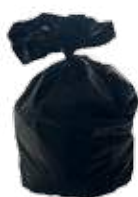
SACANID Carton de 100