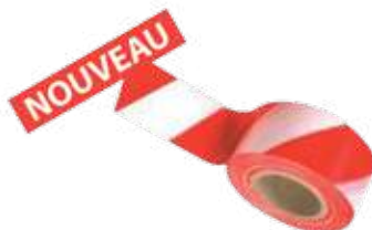
RCRB100 Le Rouleau