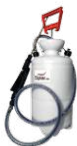
P.P.S. 50 :

Pulvé-poudreur à pression préalable ou à air comprimé.