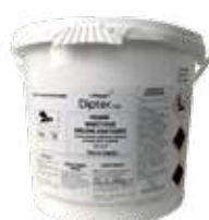
1015 P 6Kg / 20Kg

Insecticide en bille "spécial frelon asiatique"