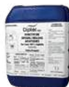
1015 VG 5L / 20L

Insecticide "spécial frelon asiatique" sur base végétale