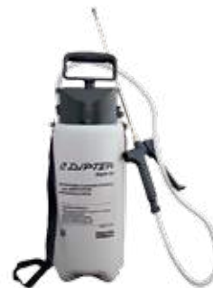
P.G.P.V. 51 :

Contenance utile 5 L pour un poids à vide de 2,8 kg. Réservoir en matière plastique résistant aux chocs et aux intempéries, joints Viton, soupape de sécurité, tuyaux PVC de 1,5 m, lance laiton de 0,4 m, robinet revolver et buse réglable en laiton, pression de service : 4 bars.