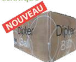
DIPTER BALL 1015B VERT 500 billes

Insecticide "spécial frelon asiatique" sur base végétale