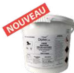
1015P-VERT 20 Kg Pyrèthre végétal