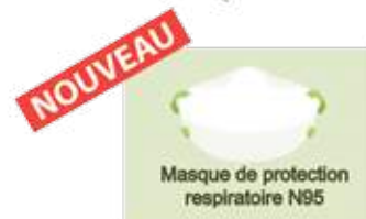
MPR-KN95 Sachet de 10