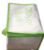
SAC ISO Pièce