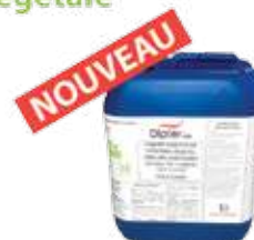
1015 VG VERT 5L

Insecticide en bille "spécial frelon asiatique"