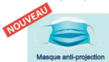
MAP50 Boîte de 50