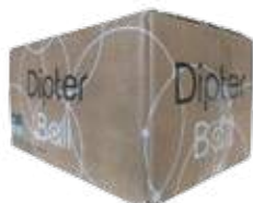
DIPTER BALL 1015B 500 billes

Insecticide en bille "spécial frelon asiatique"